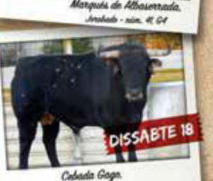
Cebada Gago, Pineda - núm. 83, G5