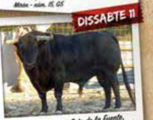
Soto de la Fuente, Castellanos - núm. 19, G4